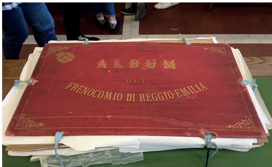
Album fotografico, 1899-1900

L'isteria è una forma di nevrosi caratterizzata da una forte instabilità emotiva e motoria, di cui erano generalmente vittime le donne. Viene analizzata per la prima volta agli inizi dell'Ottocento. Il nome deriva dal greco hysteron (utero), poiché si pensava che questa malattia colpisse unicamente le donne. I casi più classici ed eclatanti sono rappresentati dalla paralisi, dalla cecità, dagli attacchi pseudoepilettici, dalla perdita di coscienza, dalla dissociazione e dall' amnesia isterica . L'isteria si manifesta con attacchi parossistici (caratterizzati da alterazioni dello stato di coscienza, disturbi motori, sensoriali, neurovegetativi e anche neuroendocrini). È un disturbo fortemente legato a fattori connessi al periodo storico, nei suoi aspetti culturali e sociali, infatti questa diagnosi oggi è di riscontro molto raro rispetto al passato. Nei primi decenni del Novecento si colloca il nucleo centrale del lavoro di Freud, che si specializza nel trattamento della malattia nervosa in Francia presso Charcot. Da quest'ultimo apprende l'uso dell'ipnosi per la cura dell'isteria, che inizia a esercitare a Vienna.