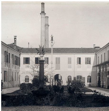
San Lazzaro, Padiglione Morel

L'omosessualità è stata a lungo considerata un disturbo psichiatrico anche se è raro trovare una diagnosi nelle cartelle cliniche degli ospedali psichiatrici che confermi quella che fino agli anni Settanta del Novecento era considerata una patologia. Gli psichiatri studiano molto il fenomeno dell'omosessualità come malattia e nel 1878 Arrigo Tamassia 1 pubblica uno studio sulla Rivista sperimentale di freniatria in cui introduce il termine (coniato dal tedesco) di "inversione sessuale", che corrisponde al termine attuale omosessualità: