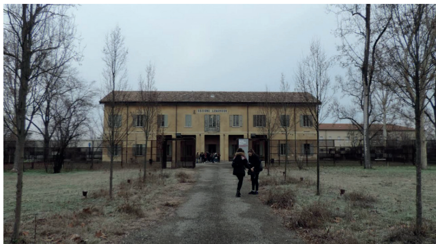
San Lazzaro, Padiglione Lombroso

Le testimonianze delle cartelle che sono riportate di seguito raccontano le vicende di quei pazienti che, durante la loro permanenza nel manicomio, hanno provato a scappare, a volte con successo altre fallendo, e che perciò prendono il nome di “evasi”. La domanda che sorge spontanea per comprendere meglio questo gruppo di individui è: le persone evadono dagli ospedali? La risposta è no, le persone evadono dal carcere e ciò ci fa capire molto sulla situazione del manicomio. Nel San Lazzaro entravano diversi pazienti che potevano avere sì dei reali problemi di tipo psichico, ma anche tutti coloro che venivano considerate persone “scomode” dalla società o che presentavano disturbi all’epoca non curabili (come la pellagra, causata da una mancanza di vitamina PP). La frustrazione, il dolore fisico e mentale, il sentirsi rinchiusi, estraniati dal mondo esterno, l’incomprensione da parte del personale, la lontananza delle persone amate, l’abbandono, erano alcuni dei tanti fattori che stimolavano una persona a cercare di fuggire da un mondo che non sentiva proprio.