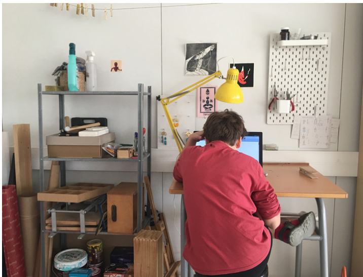
Figura 3. Zona de trabajo compartida entre artistas y alumnos del taller de la escuela Els Encants, 2019.