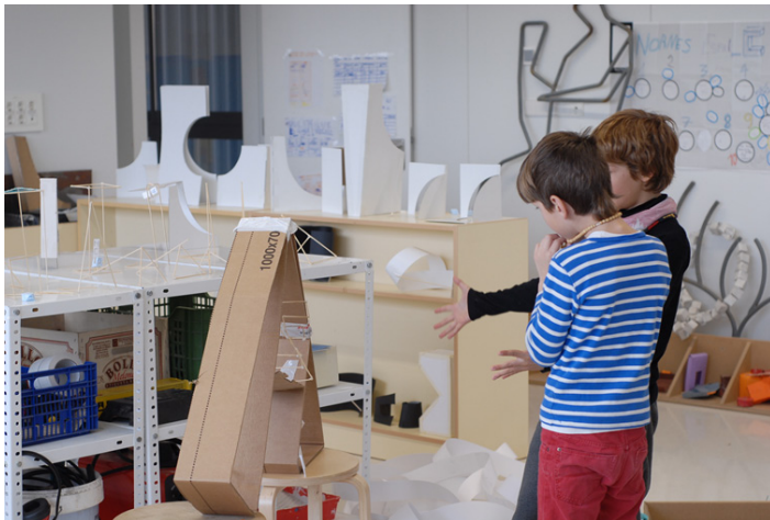
Figura 6. Zona de trabajo compartida entre artistas y alumnos del taller de la escuela Els Encants, 2016. Esculturas de los alumnos y del artista.