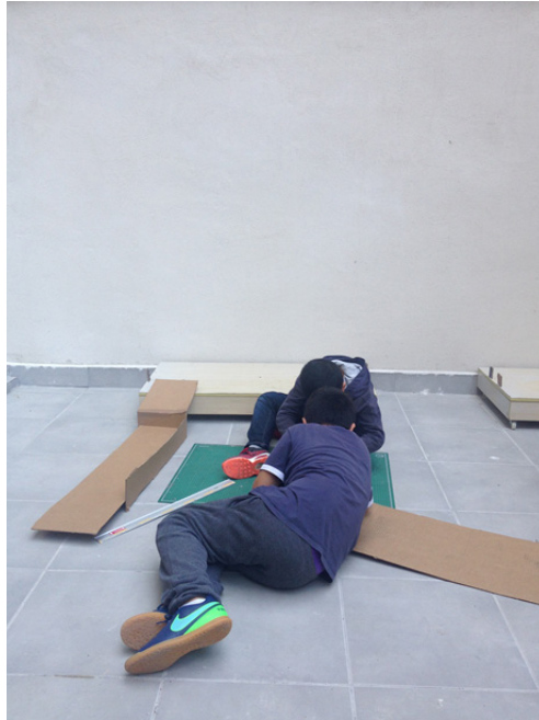
Figura 7. Proceso de creación en el taller en la escuela Miralletes, 2018.