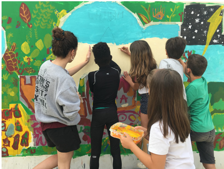
Figura 8. Realización de una pintura mural colaborativa entre todos los niños y niñas de la escuela Els Encants y los artistas residentes, 2018.