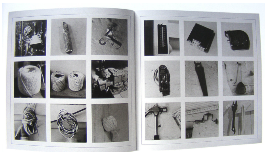
Figura 1. Sol LeWitt, Autobiography (1980). Libro de artista. The MET's Collection. © 2018 Artists Rights Society (ARS), New York.

Para construir este Foto Ensayo hemos partido de la obra Autobiography del artista Sol LeWitt (1980), un libro de artista que realizó a partir de una secuencia de más de mil fotografías en blanco y negro cuadradas, organizadas en una retícula de nueve imágenes por página. En esta obra LeWitt catalogó minuciosamente cada objeto de su vivienda-taller en Nueva York, donde el artista vivió y trabajó durante más de veinte años. Mediante la sucesión de imágenes, la obra nos muestra su experiencia vital del día a día, aunque él no aparezca retratado en las imágenes. Las fotografías son sencillas técnicamente y se muestran ordenadas de forma reticular y democrática, pues en su presentación ninguna imagen es más importante que otra. A diferencia del lenguaje verbal, que es lineal, el significado de las imágenes es variable, y las imágenes pueden ser “leídas” horizontalmente, verticalmente, en diagonal o ser vistas como una sola imagen (Garrels, 2000, p.102).