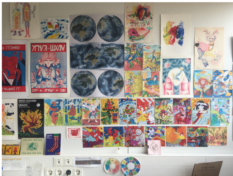
Figura 4. Muro del taller de la escuela Els Encants, con ilustraciones de los artistas residentes, 2019.