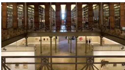
Fundació Antoni Tàpies