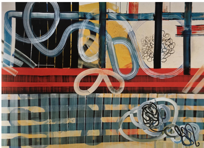
Fig. 6. Juan Uslé (1994) Welcome to the eye , Vinílico, dispersión y pigmentos sobre tela, 203x274 cm. Colección particular, Inglaterra, cortesía Timothy Taylor Gallery, Londres.

La narrativa visual Cables y Rizomas sitúa el lector en esta disposición no arbórea de los aprendizajes que se dan en el Espacio C. El taller es un espacio/tiempo de aprendizaje sin límites, circular, de pensamiento heterogéneo. Los vínculos que se establecen entre ellos también son complejos, porque no están definidas desde un inicio, debido al nuevo rol que el artista tiene en la escuela.