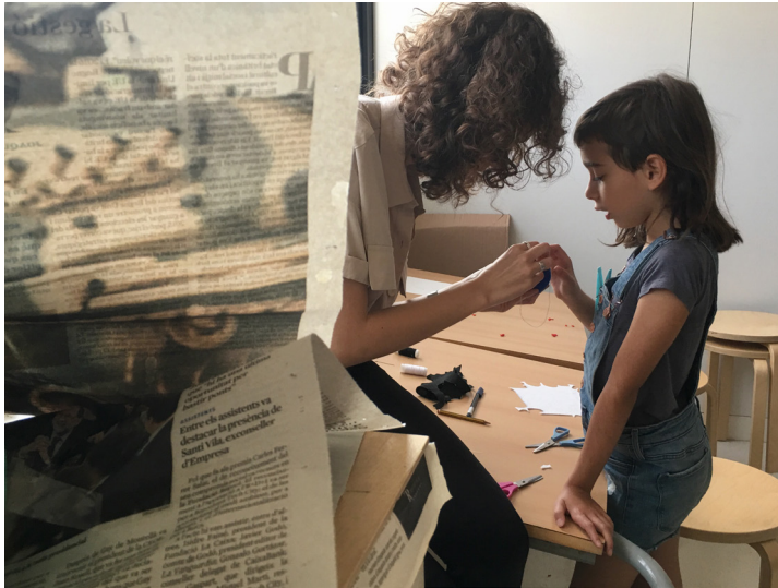
Fig. 7. Cables y rizomas IV (2018)

El acto de insertar un taller artístico dentro de los centros escolares crea dinámicas y procesos relacionales, en que las obras y proyectos están contruidos des de las relaciones entre personas distintas –adultos/artistas e infancia-, y que el contexto social, tanto del centro como de los artistas, va dando forma al proyecto, que es, como define Borriaud (2002), “la excusa para construir espacios híbridos, contaminados, entendiendo el arte como un estado de reencuentro” (p.18).