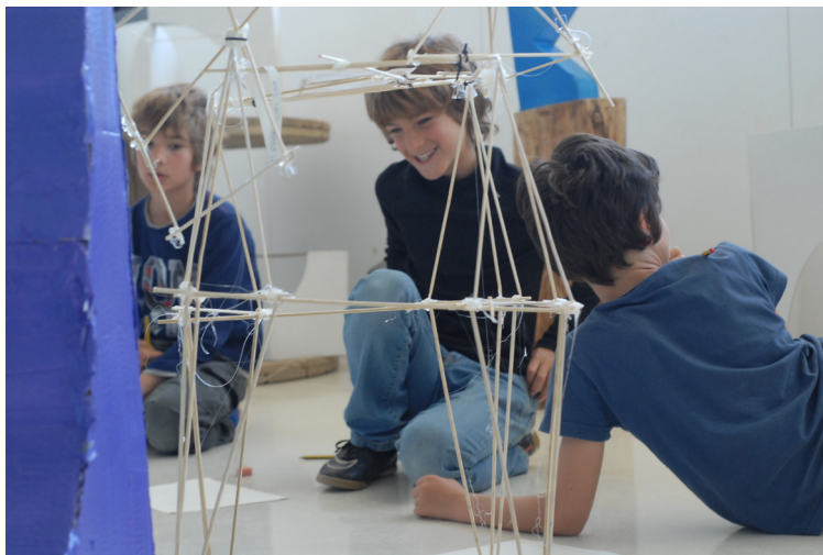
Fig. 10. Cables y rizomas V (2018)

ción de Comisiones para ordenar y resolver las necesidades que des del taller van surgiendo. Formar parte de estas comisiones ha dado voz no solo a sus representantes, sino también a todos los niños y niñas de la escuela, que a través de sus representantes han podido vehicular sus ideas y vivenciar que las estructuras democráticas dependen de la participación de la gente, tanto dentro como fuera de la escuela.