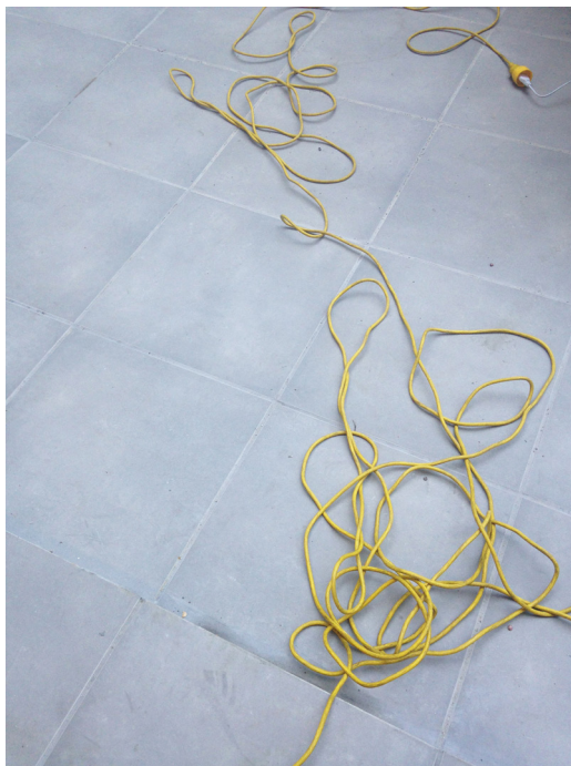
Fig. 1. Cables y rizomas I (2018)

investigación realizada en los Espacios C se conecta con la experiencia artística vivida con Juan Uslé, entendiendo “los procesos artísticos como una forma primaria de entender y examinar la experiencia, tanto de los propios investigadores como de las personas implicadas en los proyectos” (Torres de Eça, Saldanha y Vidal, p.288).