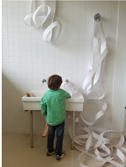
Fig. 3. Cables y rizomas II (2018)