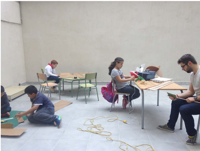
Fig. 5. Cables y rizomas III (2018)

Uno de los aspectos que más me seduce es el amplio registro de miradas, gestos y diálogos de complicidad que se establecen entre la mayoría de niños y niñas con el artista. Observar cómo el artista les escucha, y como éstos le hablan. La relación entre ellos es distinta con la que establecen con los maestros. Revisando las imágenes fotográficas realizadas en las sesiones de observación éstas revelan como sus miradas están llenas de sorpresa; sus cuerpos se retuercen en posiciones distintas a las habituales, más cercanas al baile o al juego que a la realidad escolar; sus ojos están repletos de concentración; sus bocas se llenan de risas; y los brazos se tocan entre ellos, sin pudor y sin orden. Gemma, mentora, abril 2018.