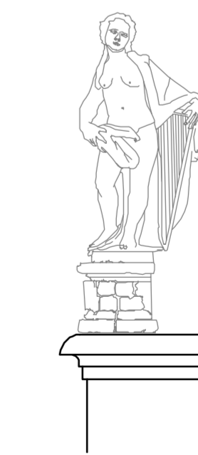
Prospetto est Particolare statua 1:25