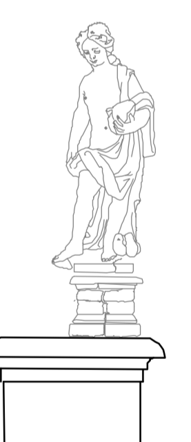
Prospetto est Particolare statua 1:25