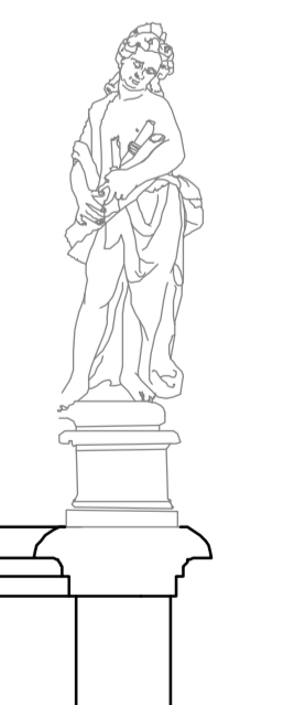
Prospetto est Particolare statua 1:25

CONCORSO SCUOLE SIFET-MIUR-CNGeGL 2013-'14 PER GLI ISTITUTI DI ISTRUZIONE SECONDARIA