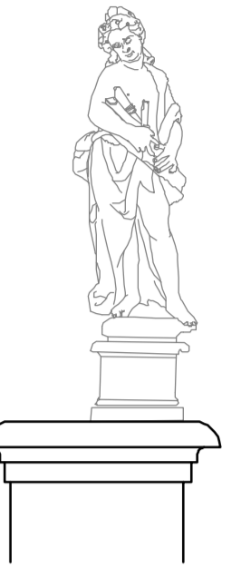
Prospetto ovest Particolare statua 1:25