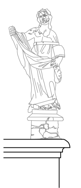
Prospetto ovest Particolare statua 1:25