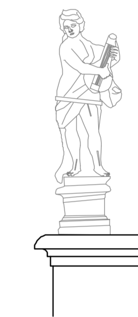
Prospetto ovest Particolare statua 1:25