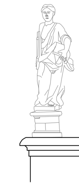
Prospetto est Particolare statua 1:25