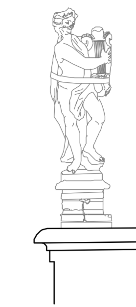
Prospetto ovest Particolare statua 1:25