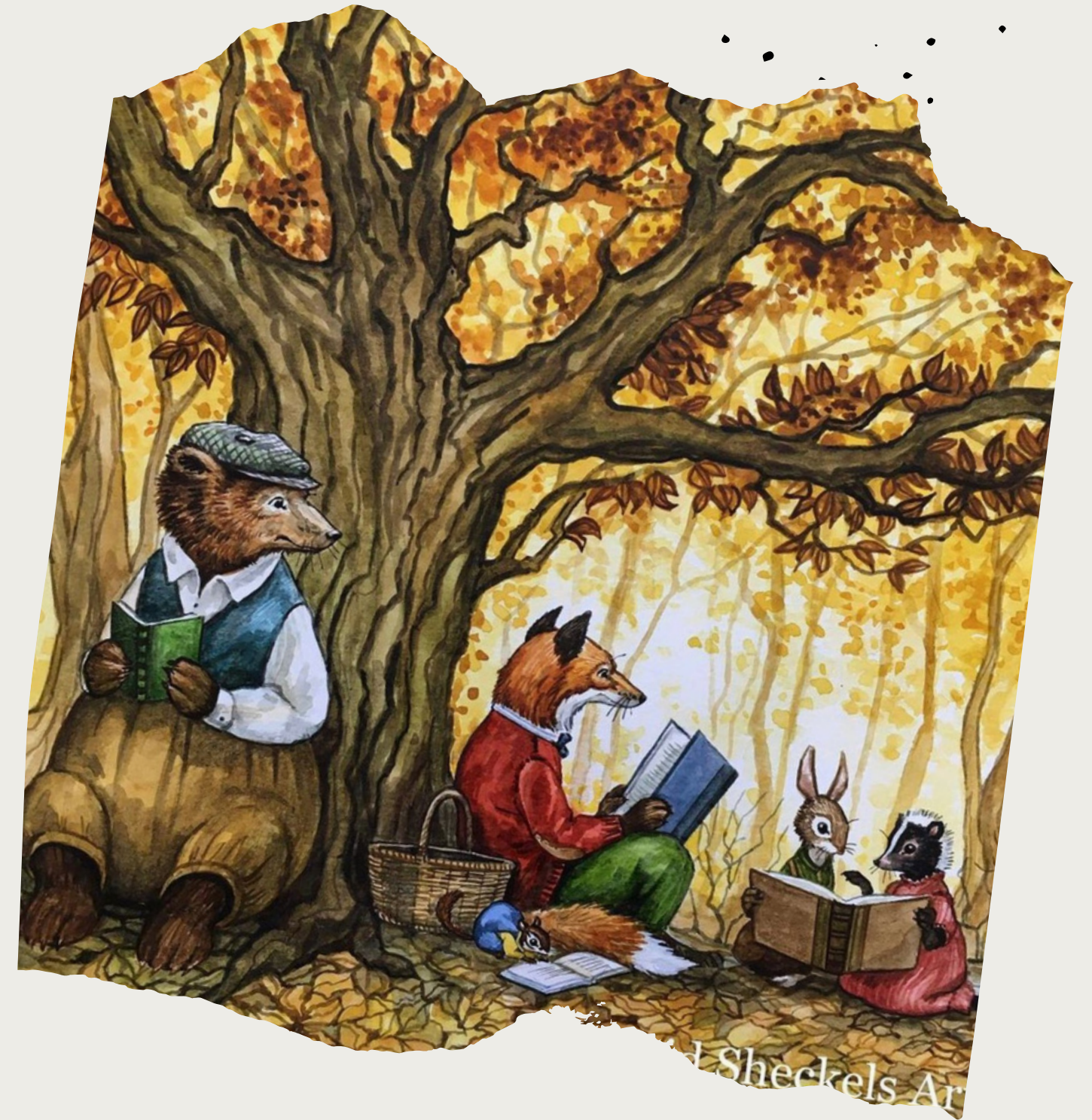
Illustrazione: Astrid Sheckels Art