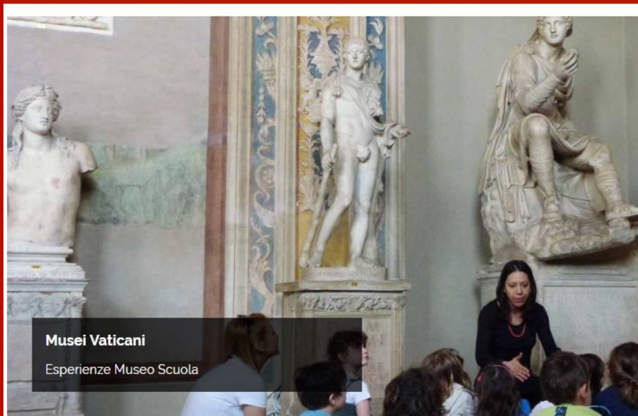
Musei Vaticani Esperienze Museo Scuola